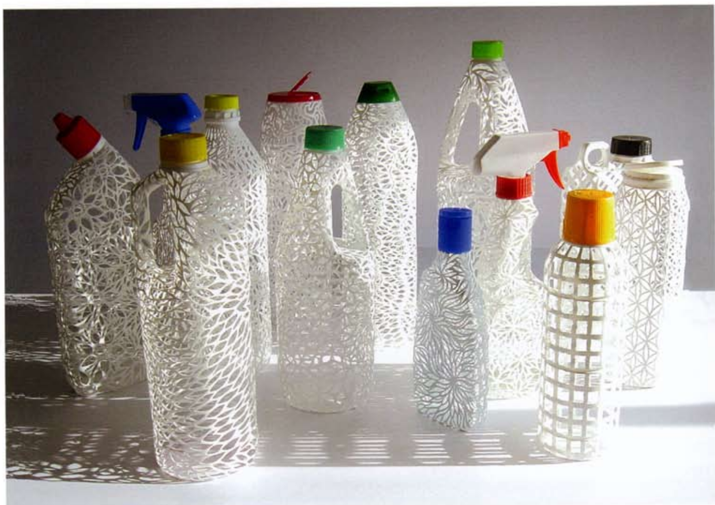
Dentelle, Lace, Spitze [détail] 2005-2008 Ensemble de 17 bouteilles de détergent découpées et animées en boucle sur moniteur Dimensions variables